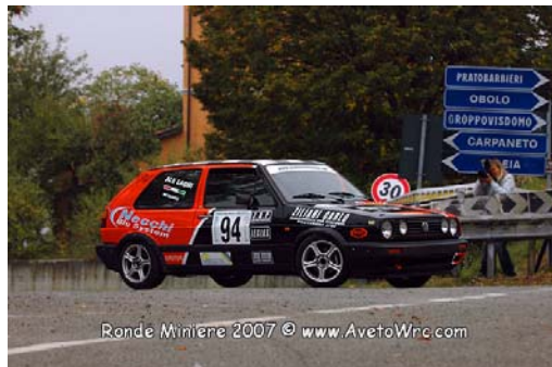
Ronde Miniere 2007