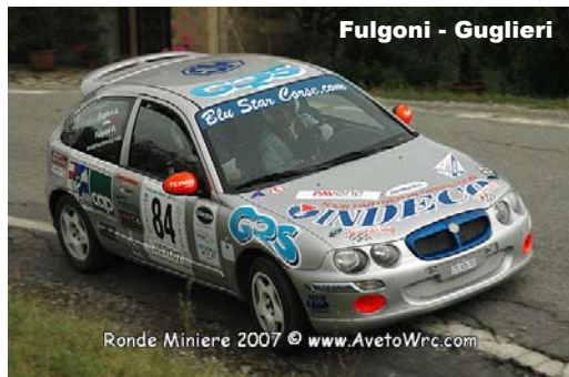
Fulgoni - Guglieri