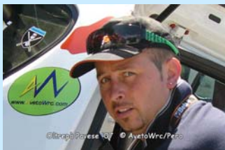
di Roby Ragalli