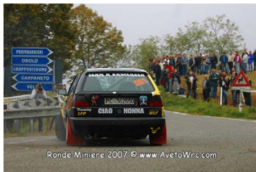
Ronde Miniere 2007