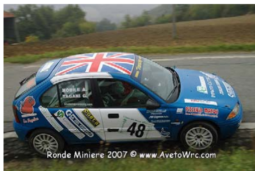
Ronde Miniere 2007

Terzo posto di classe quasi fortuito per la bella Rover 216. Mai in credito con la fortuna, questa volta l'inglesona si è ripresa qualcosa uscendo dall'ultima prova speciale al 5° posto di classe e concludendo sul palco d'arrivo al 3° Tagani e Nobile da parte loro si sono ben comportati soprattutto sui primi due passaggi.