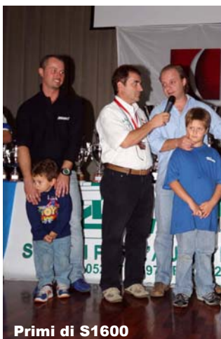
Primi di S1600

La ronde delle Miniere non è inserita nel calendario PRC 2007 in quanto ad inizio anno non era ancora inserita nel calendario CSAI. Quindi solo chi ha giocato il jolly ha potuto realizzare punti per la classifica Proracing Rally Cup. Come dice il suo stesso nome, il Proracing Rally Cup Notizie è un notiziario che riferisce dei fatti relativi allo svolgimento del Campionato della Scuderia Proracing ma che spesso ha riportato le presenze ed i risultati ottenuti dai nostri piloti anche in altre corse. In questa occasione, vista la massiccia partecipazione da parte di tanti piloti della Scuderia ed anche ai prestigiosi risultati ottenuti, pubblichiamo il resoconto ed il commento della gara di ognuno.