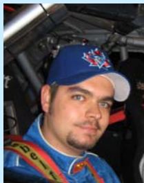
di Paolo Chimenti