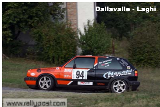
Dallavalle - Laghi