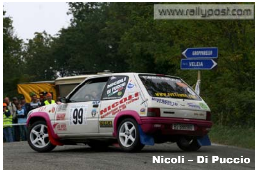
Nicoli - Di Puccio