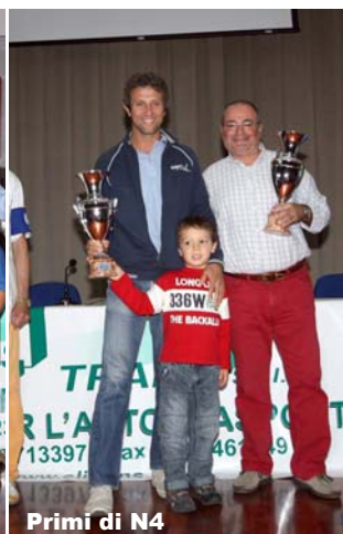
Primi di N4