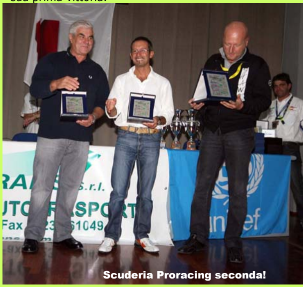
Scuderia Proracing seconda!

Come già accaduto ai Rally Città di Bobbio e Valli Piacentine, la Scuderia Proracing si è classificata al secondo posto nella classifica riservata alle Scuderie ancora una volta alle spalle dell'Idearacing. L'Idearacing perdeva prima della prima prova speciale i due equipaggi di punta lasciando una grossa opportunità alla Scuderia Proracing. E infatti lo scarto alla fine è risultato davvero minimo, meno di 20 secondi, e viene da pensare che senza il ritiro dei Valla questa volta la Scuderia avrebbe potuto centrare la sua prima vittoria.